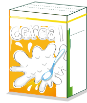
Cartón delgado de papel no cajas de alimentos