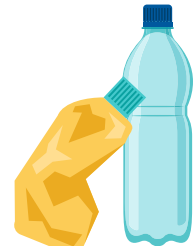
Botellas, tinas, jarras, frascos con tapas