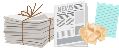
Papel, periódico & papel de oficina/mezclado