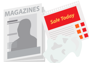
Revistas & el correo basura (propaganda)