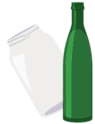
Frascos de vidrio, botellas de vidrio sin tapas